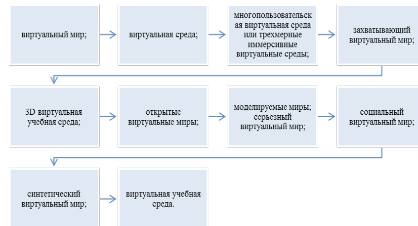
Рисунок – 1 Научные термины компьютерной технологии

Развитие виртуальных миров, как с точки зрения технических характеристик, так и с точки зрения расширяющегося спектра сообщений от многочисленных пользователей, привело к фрагментарному пониманию в литературе того, что такое виртуальный мир, а что нет. В различных источниках литературы имеются тонкие различия в определении или описании виртуальных миров. Чтобы еще больше усложнить эту проблему, в учебной и научной литературе можно найти множество терминов, (рис.1) которые используются для обозначения данной компьютерной технологии [6]: