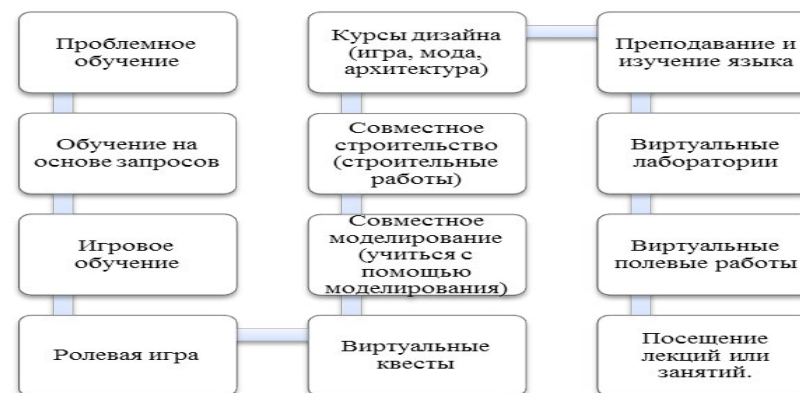
Рисунок – 2 Категории ВМ в образовательной деятельности.

Виртуальный мир в образовательной деятельности - эта категория, содержащая отдельные типы действий [9], которые использовались в виртуальных мирах, как способы преподавания и обучения в том числе (рис.2):